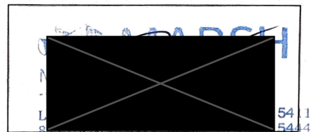
Podpis oprávneného zástupcu poisťovateľa (odtlačok pečiatky)

Získateľské číslo oprávneného zástupcu poisťovateľa 1